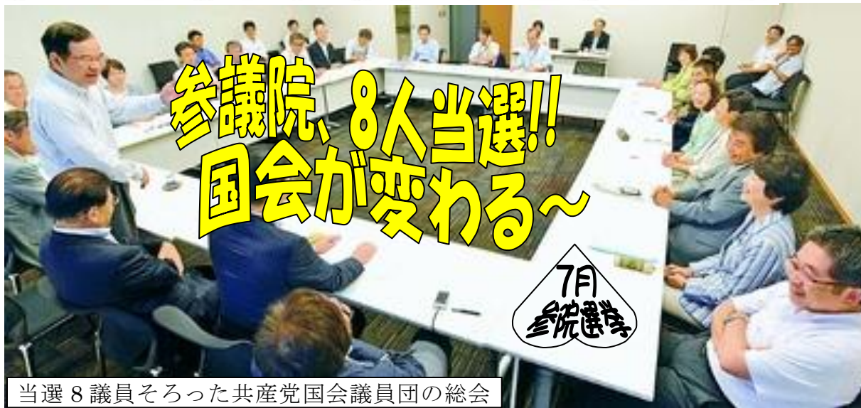
当選8議員そろった共産党国会議員団の総会

日本共産党は今回の参院選で8人の議席を獲得したことで11人の議員団となり、次のような活動が出来ます。