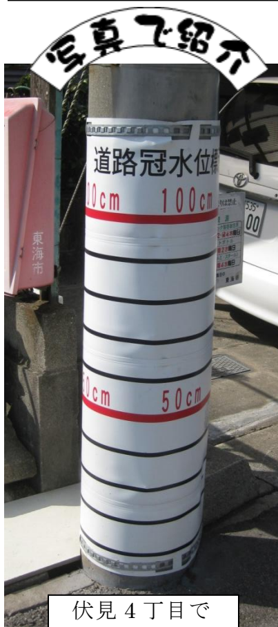
伏見4丁目で 見かけました。

「非関税障壁」とは 関税以外の方法によ って貿易を制限すること。具 体的には輸入に対して数量 制限、課徴金を課す。輸入 時に煩雑な手続きや検査 を要求すること。