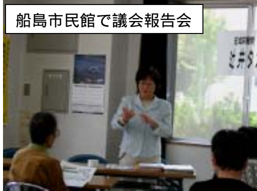
船島市民館で議会報告会

若い女性は、「年を取るのとは当たり前、自分に降りかかってくると思い真剣に考えている」「人情味のある政治をしてほしい」と解散して総選挙をしていく必要があると訴えられました。今後、各地域でこの様な会を開いていきたいと考えています。ご参加ください。