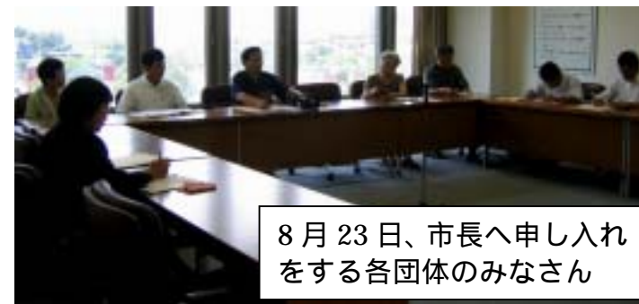
8月23日、市長へ申し入れをする各団体のみなさん

今は遠くの病院でも行けるけど、足腰立たなくなったら近くに病院はほしい。私はレジ袋使ったことがない。一人暮らしだがゴミも2ヶ月に1回しか出さないケチケチ生活で温暖化政策に協力しているつもり。中屋敷住人