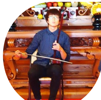
追悼の二胡演奏がありました。

「第6回大府飛行場中国人強制連行被害者殉難者追悼式典」が9月13日、東海市の玄猷寺で行われました。参加者から「ここに飛行場があった事を記録に残す、日本人の手でやっていくことに意義がある。そして、二度と過ちを侵さないようにしていかう」と呼びかけられました。